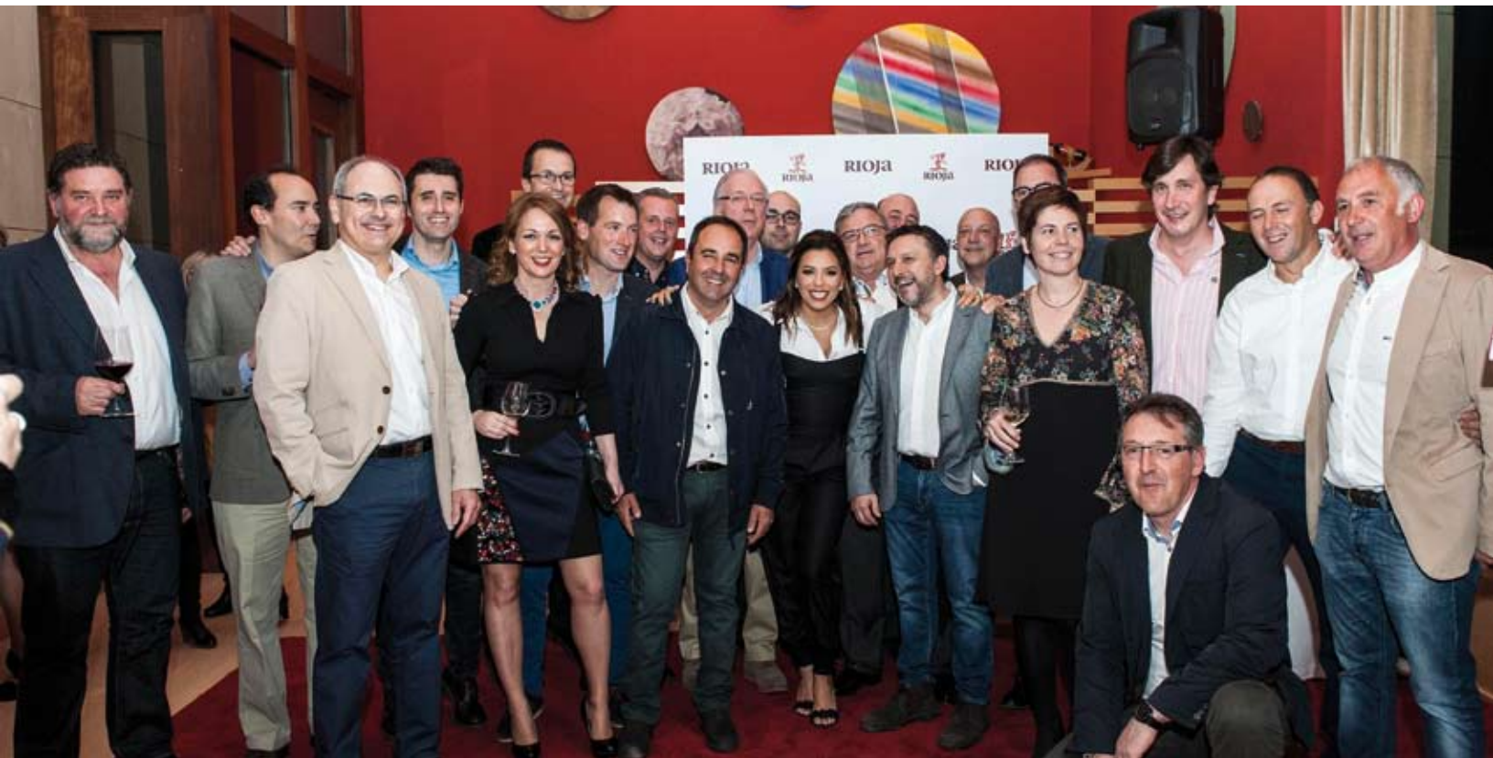
Eva Longoria mantuvo un encuentro con los vocales del Consejo Regulador en el Hotel Marqués de Riscal.