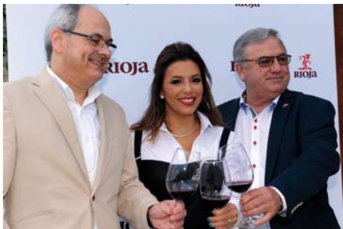
Eva Longoria con el Presidente y el Director General del Consejo Regulador de la Denominación de Origen Calificada Rioja.

La actriz Eva Longoria, embajadora del vino de Rioja en Estados Unidos y una gran apasionada de las tradiciones españolas, ha cumplido su promesa de visitar