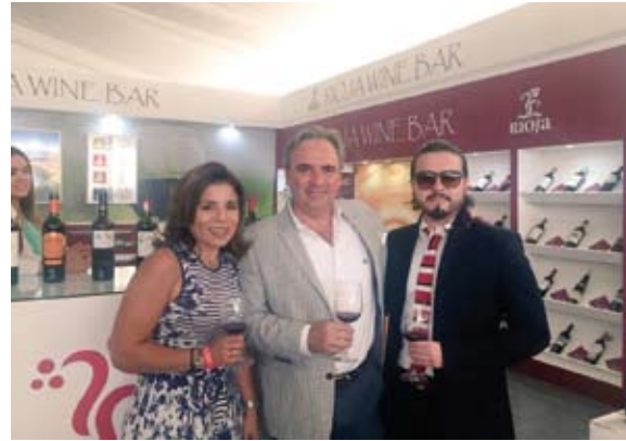
Visitantes del Wine bar de Rioja.

La exportación de vinos de Rioja ha alcanzado un total de 103,77 millones de litros -tres menos que el año anterior-, después de seis años consecutivos con un crecimiento acumulado del 43%. Este freno en el volumen exportado se ha concentrado fundamentalmente en los dos principales importadores de Rioja, Reino Unido y Alemania, que conjuntamente representan la mitad de las exportaciones. Por contra, la D.O. Ca. Rioja ha incrementado las ventas en seis de sus diez primeros importadores, destacando China (+15%), así como Suecia e Irlanda (+8%).