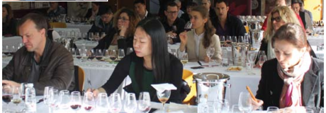
A modo de experiencia piloto, el Consejo Regulador certificó en 2016 la primera promoción de 24 'educadores de Rioja' procedentes de 8 países, que fueron expresamente invitados a participar en el programa.