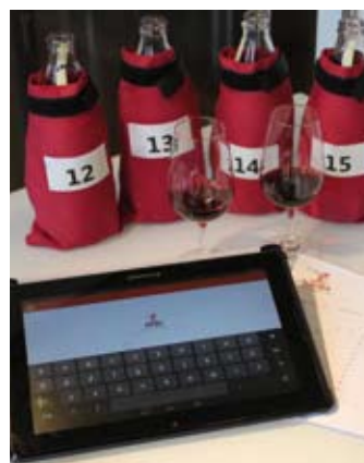
El Consejo ha elevado el nivel de exigencia para pertenecer al panel de catadores, que cuenta con 140 profesionales del sector y aumentará este año.

como la permanencia en el mismo se evalúan mediante un examen con alto nivel de exigencia y un seguimiento posterior de cada catador. Los Comités de Cata actúan bajo la supervisión de un técnico del Consejo Regulador y pasarán próximamente a estar integrados por cinco catadores en lugar de los tres actuales, con lo que se incrementará el rigor técnico de los resultados de las catas.