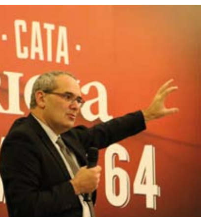
Celebrada el lunes 24 en el Hotel Wellington de Madrid, 70 periodistas especializados y prescriptores completaron el aforo máximo disponible para la cata, dadas las limitadas existencias de estos vinos en las bodegas.

Esta cualidad inimitable de los vinos de Rioja, como es su gran aptitud para el envejecimiento, ha contribuido a su reconocimiento en el ámbito internacional como una de las grandes denominaciones de origen históricas europeas. Muy pocas regiones del mundo son capaces de ofrecer, como lo hace Rioja, esos grandes vinos de añadas históricas, que duermen embotellados durante décadas en los calados de las bodegas riojanas hasta convertirse en auténticas joyas enológicas, leyendas fraguadas a lo largo del tiempo.