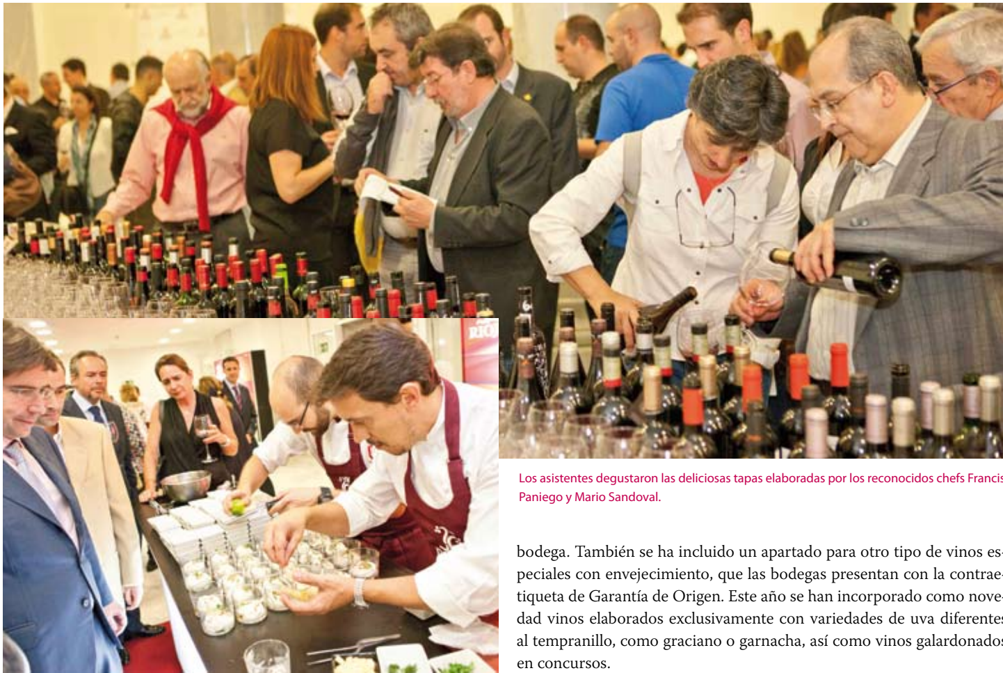
Los asistentes degustaron las deliciosas tapas elaboradas por los reconocidos chefs Francis Paniego y Mario Sandoval.